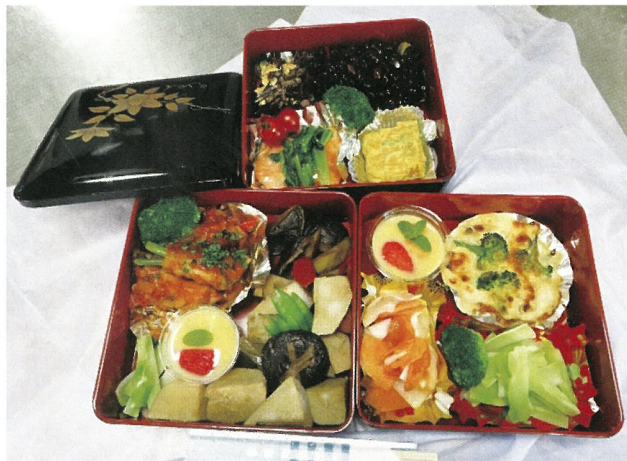
「高松産ごまごま」男の料理教室