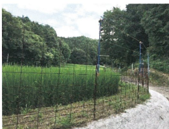
侵入防止柵設置例

防護柵の設置に伴う補助制度も各種ありますので、設置前に最寄りのJA又は農林水産課まで、お問い合わせください。