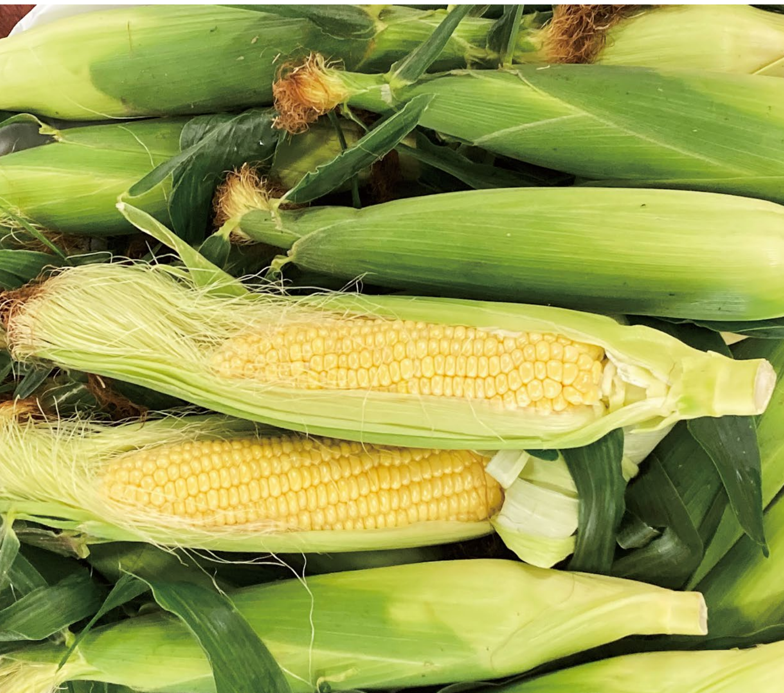
まんのう町で採れたトウモロコシ